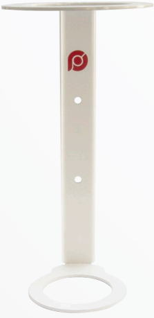
Saflaştırıcı Filtre Tutucu

GLF-30 Gaz Hatları için Saflaştırıcı Filtre dişi ve erkek bağlantıları ile kolayca sökölüp takılabilir. Her tip gaz hattında kullanımı için konnektör setleri mevcut olup, tasarımı özel olarak yapılan filtre tutucu sayesinde güvenli kullanım sağlar.