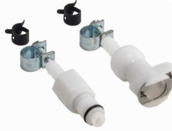
Silikon Hortum Uyumlu Konnektör Seti