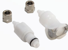
Pnömatik Hortum Uyumlu Konnektör Seti